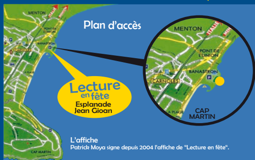
L'affiche Patrick Moya signe depuis 2004 l'affiche de "Lecture en fête".

* Liste non exhaustive au 06/11/24 Livres en vente sur place